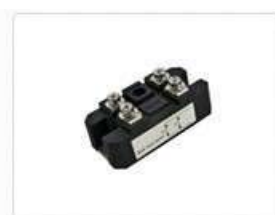
Диодные мосты однофазные MDQ