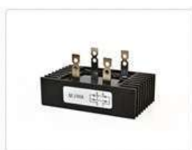
Диодные мосты однофазные QL