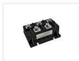
Диодные мосты трёхфазные MDS