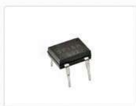
Диодные мосты однофазные DF10M

Минск www.fotorele.net www.tiristor.by email minsk17@tut.by тел.+375447584780 и другие, радиодетали, электронные компоненты каталог, описание, технические, характеристики, datasheet, параметры, маркировка, габариты, фото, аналог, замена смотрите ниже