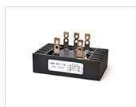
Диодные мосты трёхфазные SQL