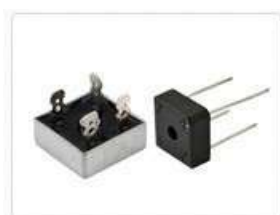
Диодные мосты однофазные KBPC